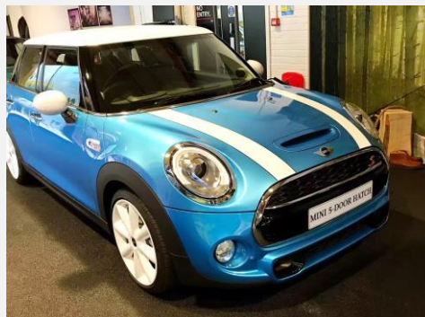
Mini Cooper 公司访问